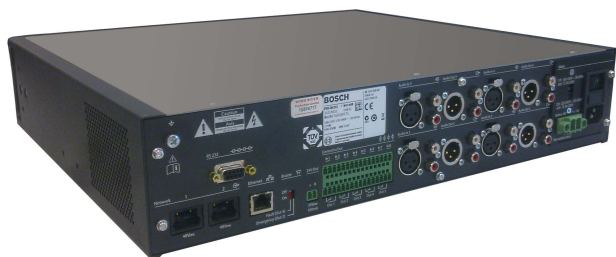
PRS-NCO3 – widok z tyłu