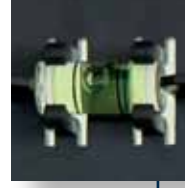
Entegre su terazisi Kolay kurulum için