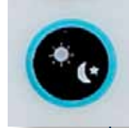
Butonların üzerinde simgeler Sezgisel çalıştırma için

Konvansiyonel Yangın Paneli 500 Serisi küçük dükkanların, depoların, üretim tesislerinin, ofis binalarının, okulların ve anaokullarının ihtiyaçlarını ve beklentilerini ideal şekilde karşılar. Bu seri, sekiz bölge ve 256 dedektöre kadar üç farklı panel tipinden oluşabilir. Bu sağlam panellerin modern, çekici tasarımı ve küçük boyutu dekora farkedilmeden uyum sağlamasını sağlar.