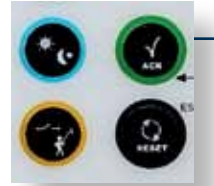
Renk kodlamalı kullanıcı arayüzü Kolay kullanım için