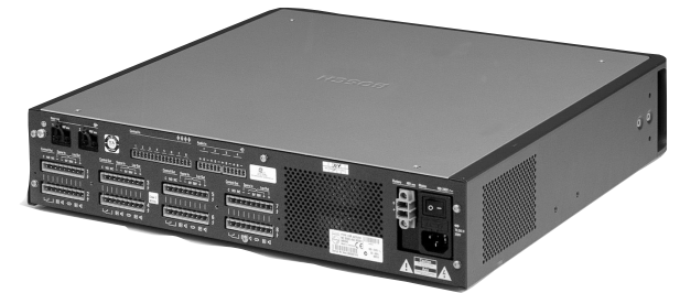
LBB 4428/00 功率放大器后视图, 8 x 60 W