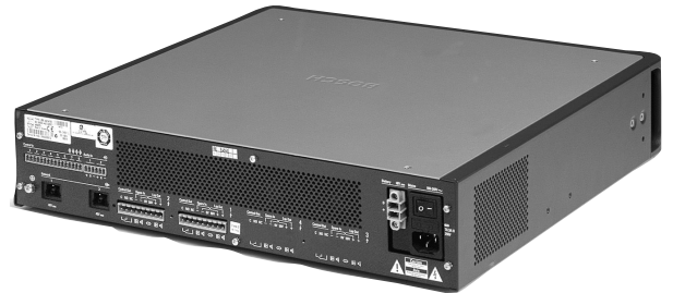
LBB 4422/10 功率放大器后视图, 2 x 250 W