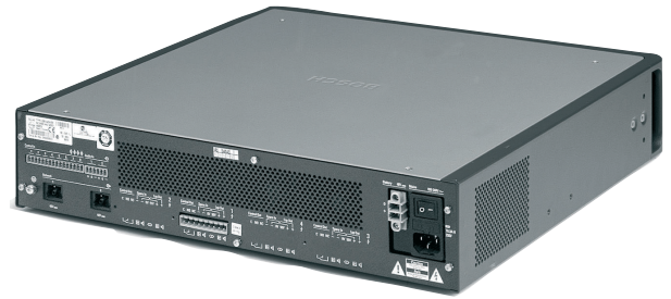
LBB 4421/10 파워 앰프(500W x 1) 뒷면