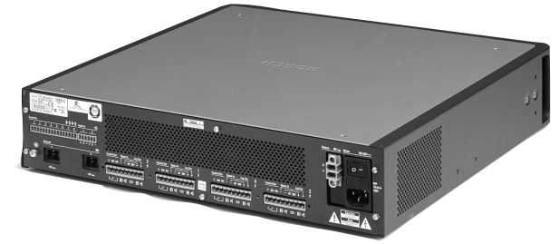
LBB 4424/10 파워 앰프(125W x 4) 뒷면