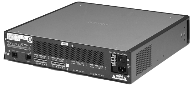
LBB 4422/10 파워 앰프(250W x 2) 뒷면