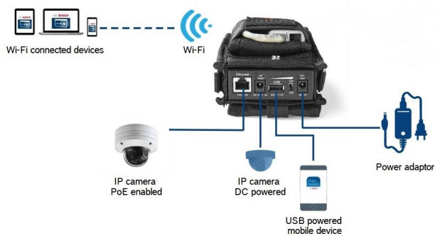
Interface van draagbare tool voor camera-installatie