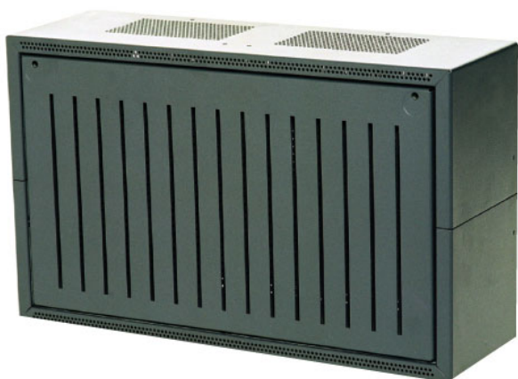
► Распр. коробка

DIB 0000 A Распределительная коробка оснащена распределительной шиной по стандарту EN 60715, и используется для установки последовательных терминалов.