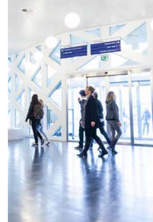
PAVIRO: sistema de chamada e evacuação por voz com qualidade de som profissional