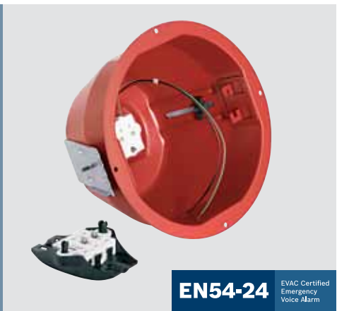
EN54-24 EVAC Certified Emergency Voice Alarm

สำหรับการประยุกต์ใช้งานที่เน้นการป้องกันอัคคีภัย ผู้ใช้สามารถติดตั้งและเชื่อมต่อลำโพงแต่ละตัวเข้ากับ fire-dome ชนิดใดชนิดหนึ่งได้ ขั้วต่อเซรามิกแบบใหม่พร้อมอุปกรณ์ "ต่อพ่วง" บน fire-dome ช่วยให้ผู้ใช้สามารถเดินสายระบบ E30 ก่อนล่วงหน้า และทำการทดสอบก่อนเชื่อมต่อกับลำโพงแบบติดเพดาน ซึ่งช่วยลดเวลาในการติดตั้งและสอดคล้องตามมาตรฐาน EVAC ด้วย