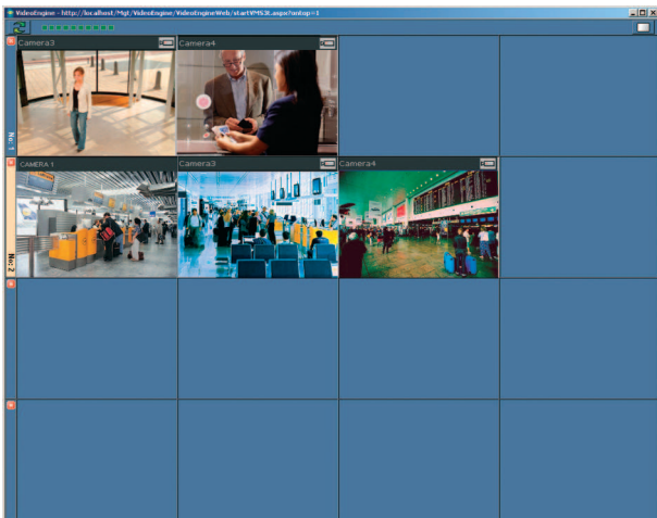
图片 1: 具有2种活动报警情况的报警矩阵的示例