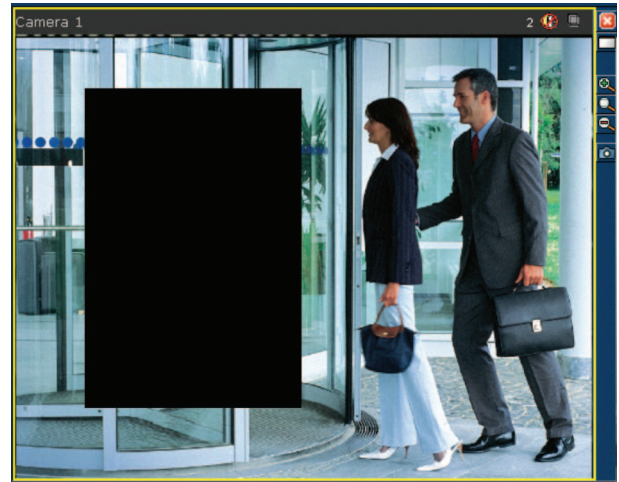
图片 2: 由隐私区域功能遮挡的区域