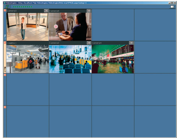
Şek. 1: 2 etkin alarm durumuna sahip bir alarm matrisi örneği