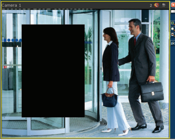
Şek. 2: Gizli Bölgeler özelliği tarafından maskelenen alan