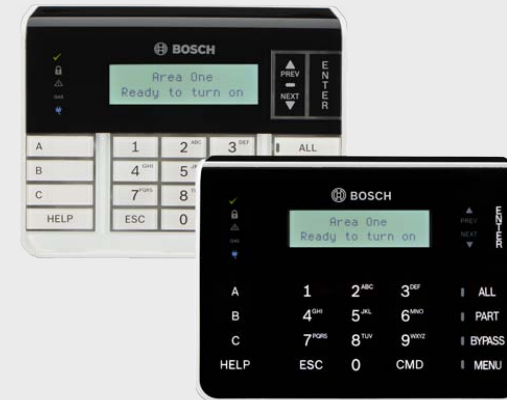
双行字母数字键盘 B920/B921C