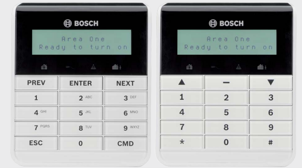
Clavier texte B915/B915I

Tous les noms de matériels et logiciels utilisés dans le présent document sont probablement des marques déposées et doivent être considérés comme telles.