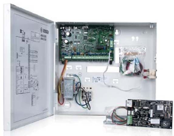
Integrerad systemteknik: samtliga versioner i AMAX-serien har samma konstruktion

Vi på Bosch tar våra kunders skydd och säkerhet på största allvar genom att leverera branschledande högkvalitativa inbrottslarmssystem: AMAX-serien från Bosch är en skalbar plattform som gör att du kan möta dina kunders enskilda behov av skydd i allt från bostäder till små och medelstora kommersiella fastigheter.